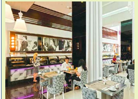
Frühstück in stilvollem Ambiente