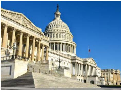
Das Kapitol in Washington (Zusatzausflug)